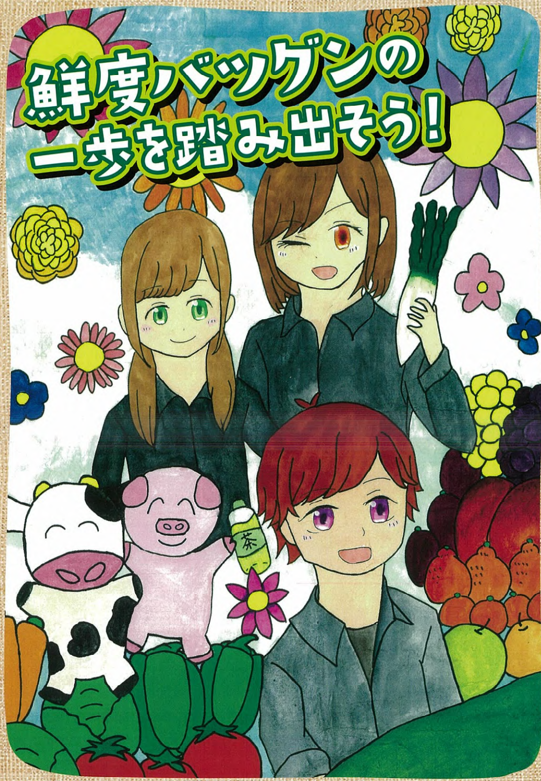
イラスト制作：令和4年度 鹿児島県立農業大学校 農学部果樹科2年 市来 葵